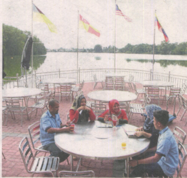
Diners having a quick drink at the restaurant at the pavilion

In fact, he added, Tasik Biru Kundang had been hosting the