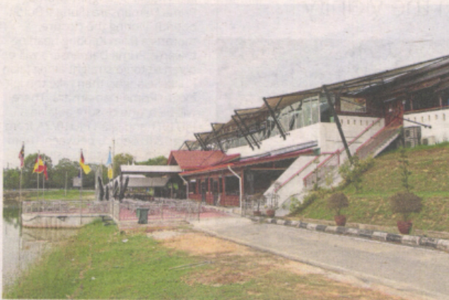
Pavilion Tasik Biru Kundang has an air-conditioned function room on the first floor which can accommodate 500 people

"We love the scenic lake and the facilities that have been put in place by MPS. They fit the purpose of drawing spectators who enjoy this sport," he said.