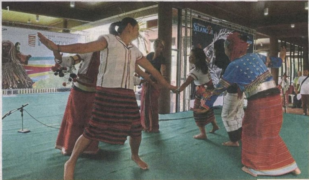
1 Foreign indigenous delegates from the Philippines, Thailand, India and Indonesia performing a dance on stage on the first day.

Provided for client's internal research purposes only. May not be further copied, distributed, sold or published in any form without the prior consent of the copyright owner.