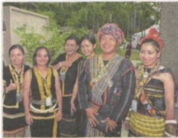
Celebrating indigenous cultures > 18&19