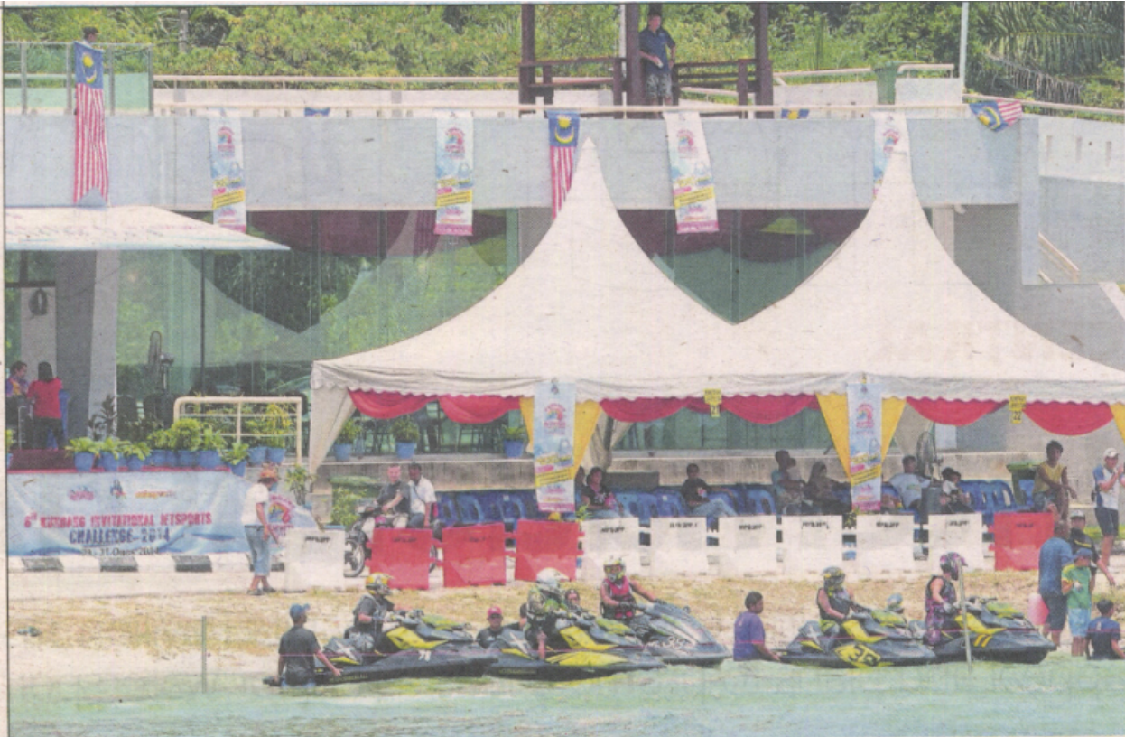
Participants waiting to be flagged off outside Pavilion Tasik Biru Kundang at last year's 7th International Jet Sports Challenge.