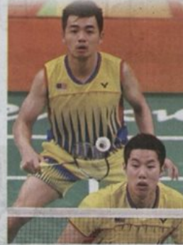
马来西亚羽毛球男双杀入奥运决赛为国争光。

Bersih 4 之前，退伍军人福利组织 (Kerabat) 便称，所有参与 Bersih 4 的都是爱国者；马老爷更是连讯带讯，不爱国那个才是纳大人。