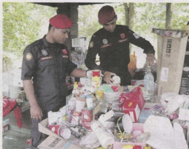
Anggota penguat kuasa membersihkan pondok wakaf yang dijadikan rumah oleh gelandangan.

"Kerja pembersihan dilakukan serta-merta dan pada