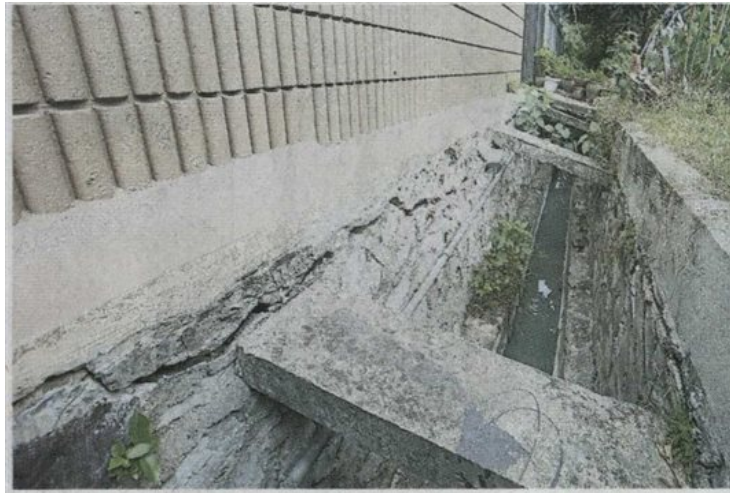
■甲洞英达柏兰岭花园10路沟渠出现裂缝，引起居民忧虑。

Provided for client's internal research purposes only. May not be further copied, distributed, sold or published in any form without the prior consent of the copyright owner.