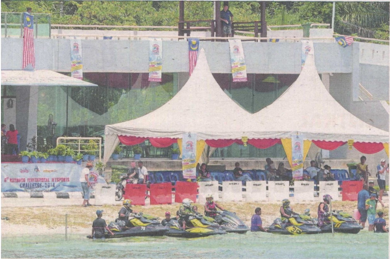
Participants waiting to be flagged off outside Pavilion Tasik Biru Kundang at last year's 7th International Jet Sports Challenge.