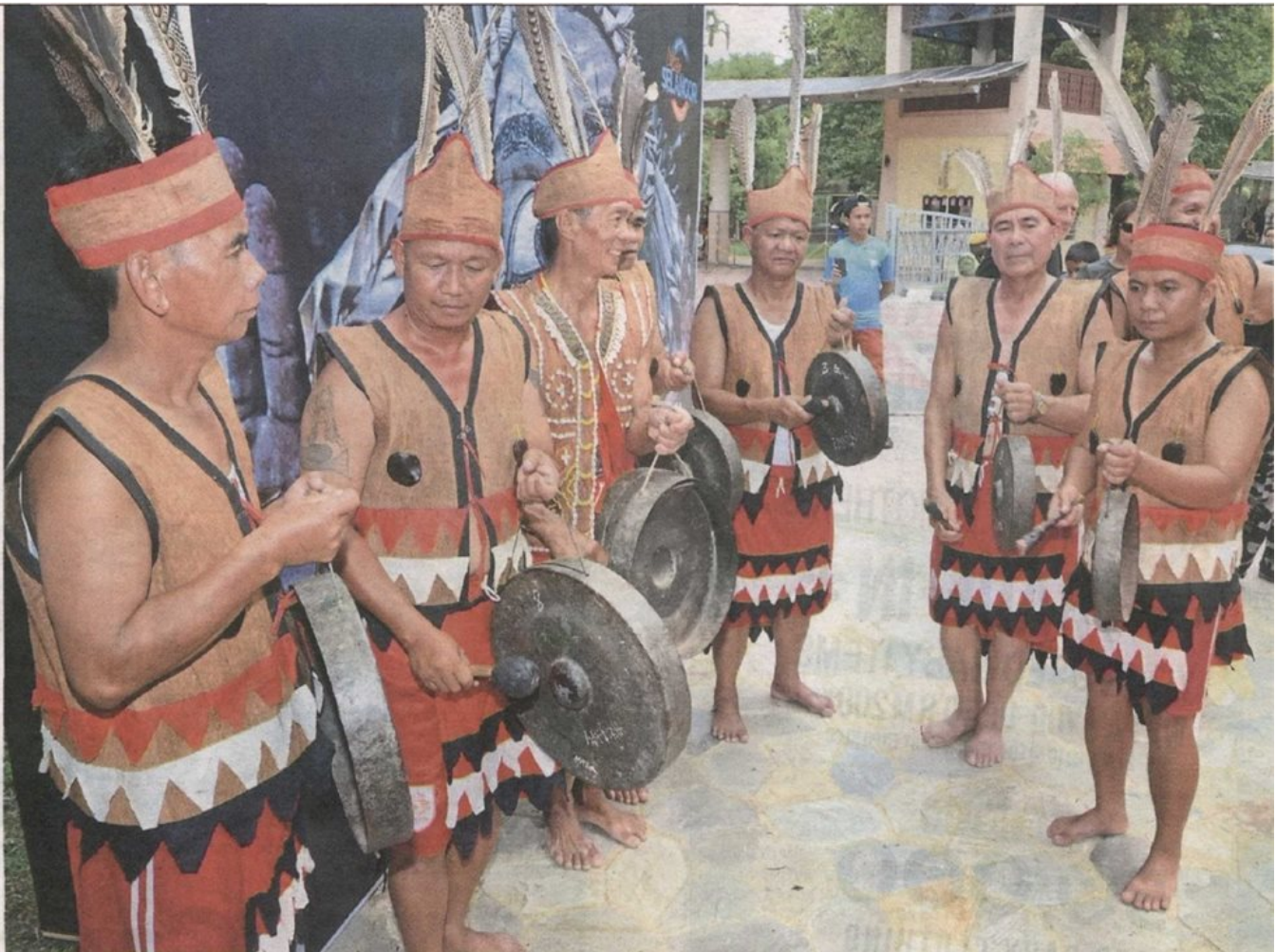
A troupe of Murut men from Sabah in terap shirts and playing a gong set during the official launch of the Selangor International Indigenous Arts Festival 2016.