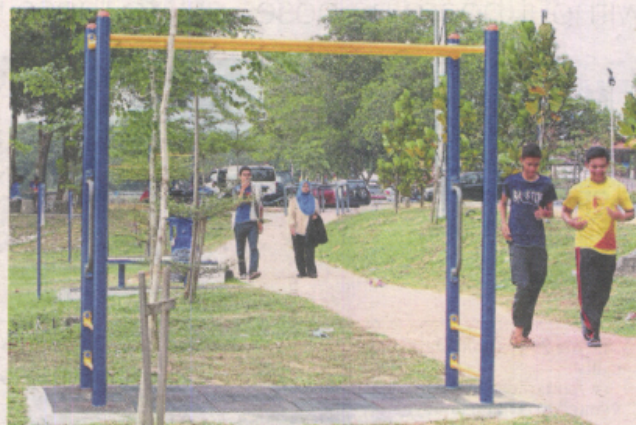
The lake is frequented by nearby residents, thanks to its jogging trail that has exercise equipment along its route.