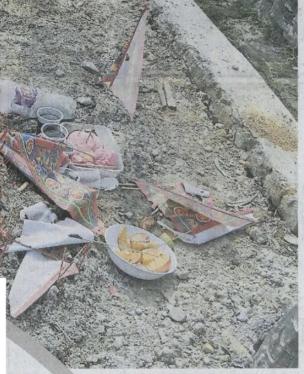
■在锡米山巴西尔玛斯花园，路边一堆堆的祭品。