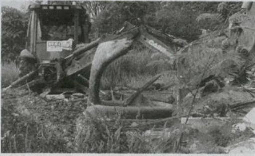
மண்வாரி இயந்திரங்களை கொண்டு கோயிலை உடைக்கின்றனர்.

நேற்று காலை, இங்குள்ள கம்போங்ஜாவா 4 - ஆவது மைலில் உள்ள நாகம்மாள் ஆலயம் மாநகர் மன்ற அமலாக்க அதிகாரிகளால் மண்வாரி இயந்திரங்களை கொண்டு தரைமட்ட