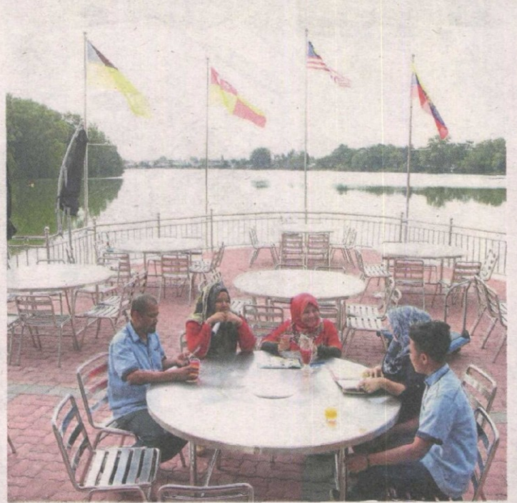
Diners having a quick drink at the restaurant at the pavilion

In fact, he added, Tasik Biru Kundang had been hosting the