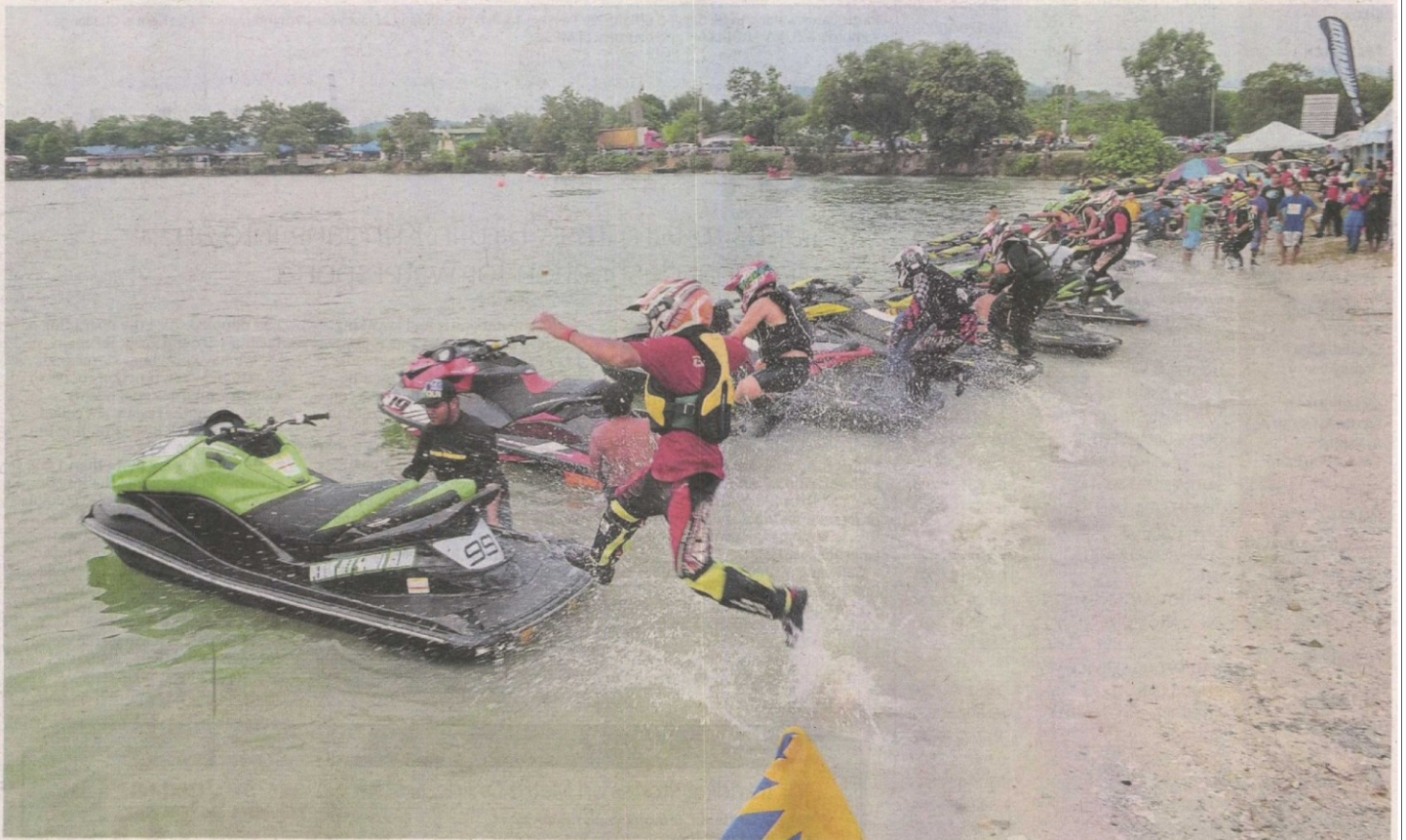
Flag off: Contestants jumping onto their jetskis at the start of the 7th International Jet Sports Challenge last year at the Pavilion Tasik Biru in Kundang.

Selayang Municipal Council believes that its Pavilion Tasik Biru Kundang has global appeal and plans to promote it as a hub for watersports. > 2&3