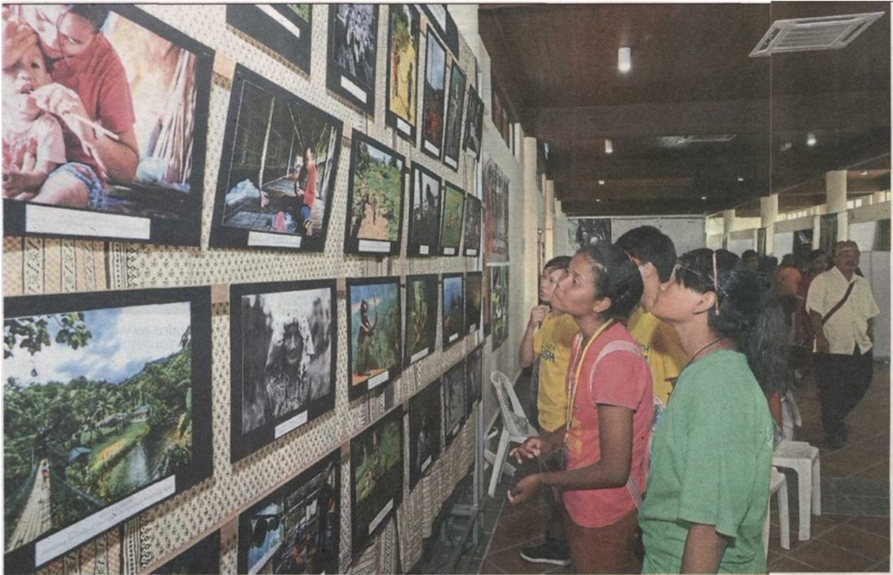
Visitors viewing photos on display at the Botanical Gardens' main building.