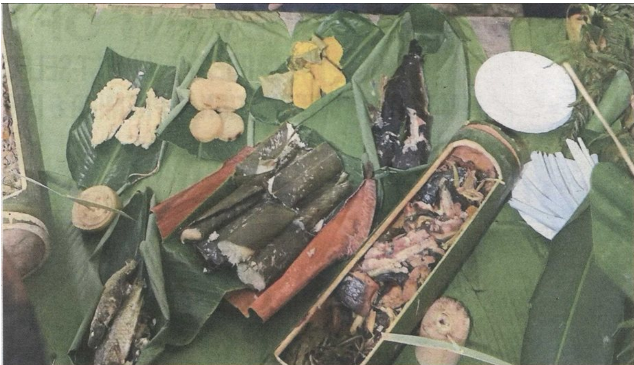
A sampling of indigenous diet – fried tapioca flour and slices of boiled tapioca (top left), bamboo-cooked chicken (far right), glutinous rice wrapped in aromatic leaves (centre) and fish cooked in bamboo (bottom left and top right).