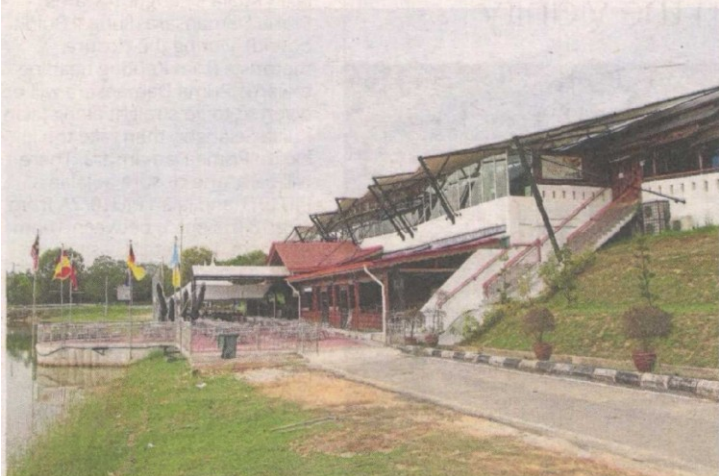
Pavilion Tasik Biru Kundang has an air-conditioned function room on the first floor which can accommodate 500 people

"We love the scenic lake and the facilities that have been put in place by MPS. They fit the purpose of drawing spectators who enjoy this sport," he said.