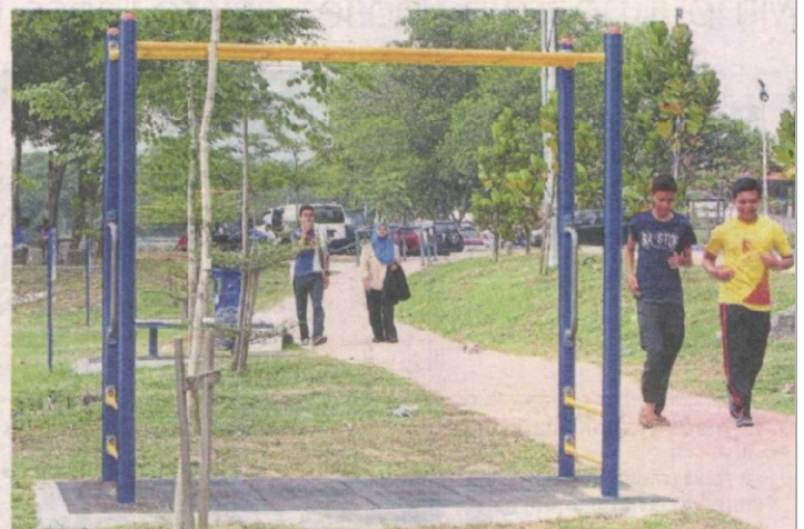
The lake is frequented by nearby residents, thanks to its jogging trail that has exercise equipment along its route.