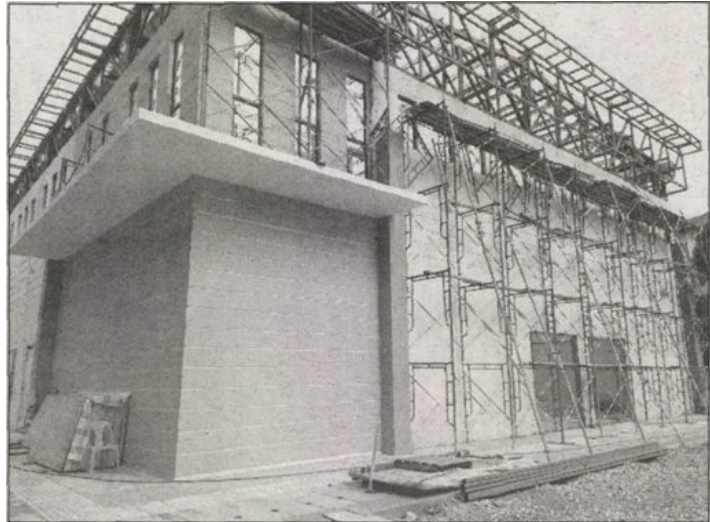
蒲种公主城多用途礼堂即将竣工，占地7000平方公尺，可供居民租用进行社区活动或设宴。