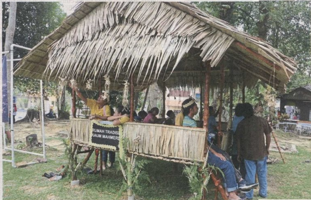
2 Traditional living spaces of the Temuan and Mah Meri on display at the festival.