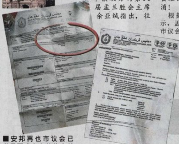
■安邦再也市議會已發函要求主辦單位支付1600令吉的盂蘭勝會准證費用。