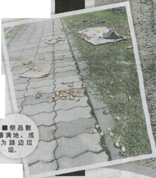
■祭品散落满地，成为路边垃圾。