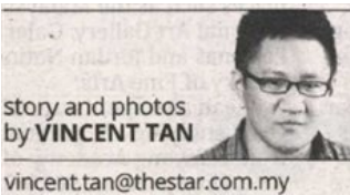
story and photos by VINCENT TAN

21 Malaysian and overseas tribes take part in two-day festival at Shah Alam park