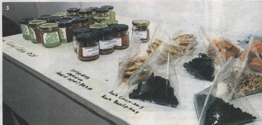
3 North Bornean delicacies and foodstuff such as kuih cincin, peppers and honey on display at the Pacos (Partners of Community Organisations in Sabah) Trust booth.